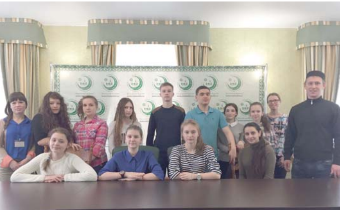
5 апреля в рамках проекта "Диалог культур" "Московский Муфтият" посетили ребята из центра социального обслуживания Московский.