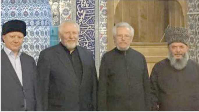
23-24 марта в городе Нальчик в рамках поездки на Северный Кавказ Альбир-хазрат Крганов посетил Культурный центр народов Кавказа в Пятигорске.