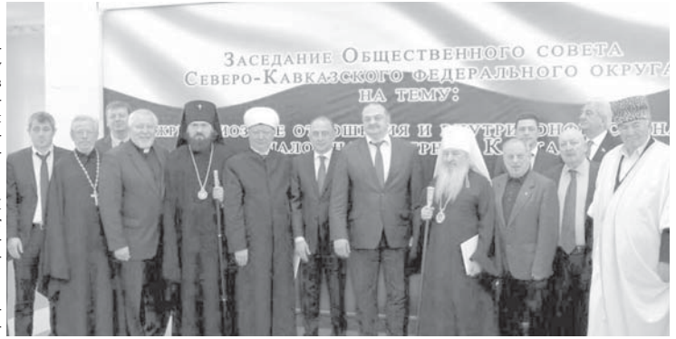
Северо-Кавказский федеральный округ и распространить практику проведения подобных мероприятий в других федеральных округах Российской Федерации.

Участники конференции планируют регулярно организовывать подобные форумы в разных регионах, входящих в