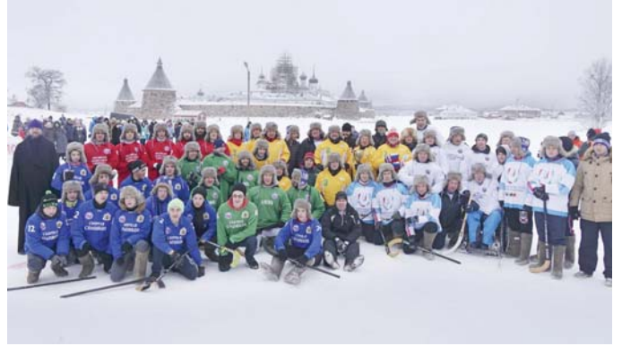
В Архангельской области на острове Соловки, прошел турнир по хоккею в валенках "Соловецкие Сполохи", в котором приняла участие команда активистов Дискуссионного Молодежного Мусульманского Клуба при Духовном Управлении Мусульман г. Москвы и Центрального региона «Московский Муфтият».